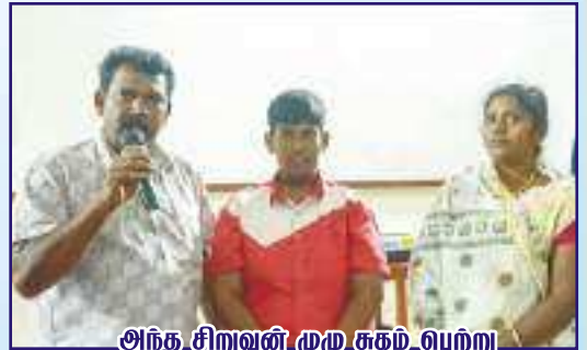
அந்த சிறுவன் முழு சுகம் பெற்று