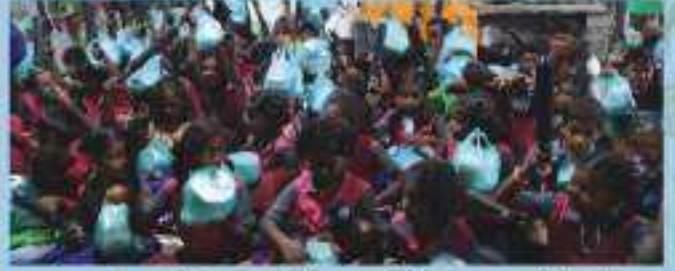
உதவி பெற்ற பிள்ளைகளில் ஒரு பகுதியினர்...