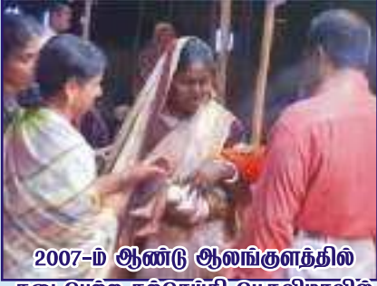
2007-ம் ஆண்டு ஆலங்குளத்தில் நடைபெற்ற நற்செய்தி பெருவிழாவில் உறுப்புகள் செயலிழந்த நிலையில் சகோதரரிடம் ஜெபிக்கும் காட்சி

எனது இரண்டாவது மகன் பிறந்தபொழுது கை, கால்கள் மற்றும் உறுப்புகள் எதுவும் செயல்படவில்லை. குழந்தை பிழைக்குமா என்ற கேள்விக்குறி, அப்படி பிழைத்தாலும் படுத்த படுக்கை தான் என்ற நிலைமை. குழந்தையின் நிமித்தம் நாங்கள் கண்ணீர் வடித்தோம். எவ்வளவோ மருத்துவர்களை சந்தித்தும், சிகிச்சை அளித்தும் எந்தவொரு பயனுமில்லை. சிறப்பு குழந்தையை போல தூக்கி சுமக்க வேண்டிய நிலைதான் என்று கூறிவிட்டனர்.