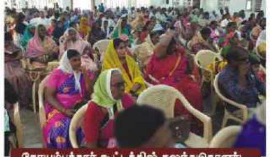
கோயம்புத்தூர் கூட்டத்தில் கலந்துகொண்ட மக்களில் ஒரு பகுதியினர்

மேற்சுறப்பட்ட வசனத்தில் தேவன் ஏசாயாவிடம் கேட்டதுபோல தேவன் நம்மைப்பார்த்து இன்றும் கேட்டுக்கொண்டிருக்கிறார்.