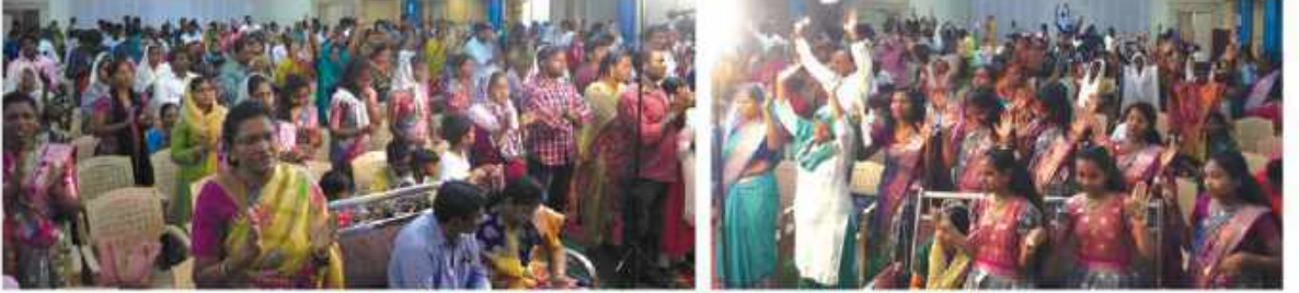
வாராங்கல் கூட்டத்தில் கலந்துகொண்ட மக்களில் ஒரு பகுதியினர்

நம் கூட்டங்களின் முடிவில் வந்திருந்த ஒவ்வொரு நபருக்கும் தனித்தனியே ஷெய்த்து ஆலோசனை வழங்குகிறோம். இதன் மூலமாக தற்கொலைக்கு நேராக ஓடும் அநேக உள்ளங்கள், உடைந்த, சோர்வுற்ற இதயங்கள் ஆறுதல் அடைகின்றன. பிரிந்த குடும்பங்கள் இணைக்கின்றன. கர்த்தருக்கு சாட்சியாக வாழ்கின்றனர்.