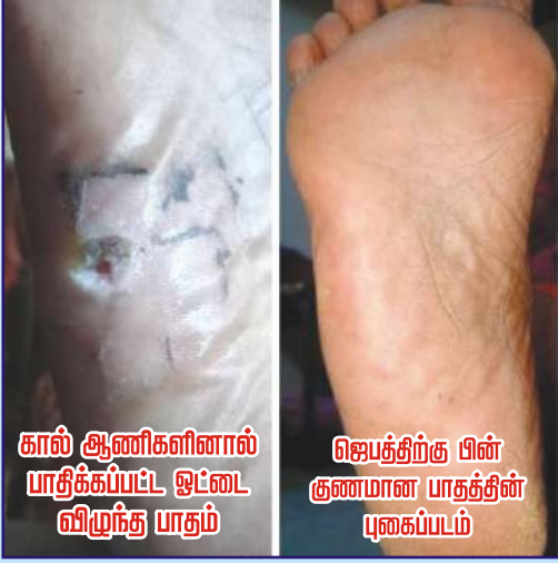
கால் ஆணிகளினால் பாதிக்கப்பட்ட ஓட்டை விழுந்த பாதம்