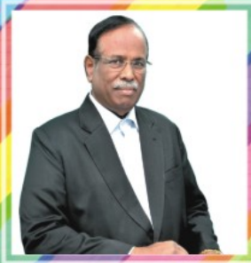
Dr. ஆனந்த ஸ்திரா மார்ச் - 13