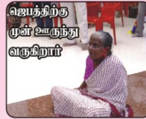
ஜெபத்திற்கு முன் ஊருந்து வருகிறார்

நவம்பர் மாதம் நடைபெற்ற திருச்சி அற்புத குடும்ப ஆசீர்வாதக் கூட்டத்தில் சுமார் 15 ஆண்டு காலம் நடக்க முடியாத ஒரு தாய் ஜெப