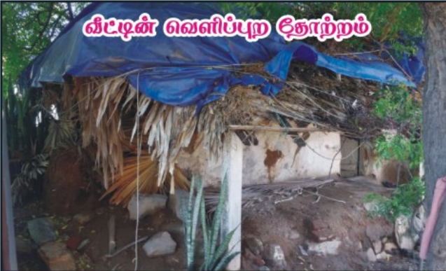
வீட்டின் வெளிப்புற தோற்றம்