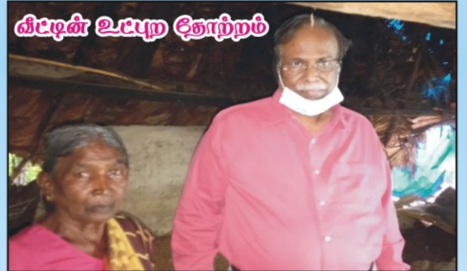
வீட்டின் உட்புற தோற்றம்

புதியதாக கட்டப்பட்ட வீட்டை சகோதரன் திறந்து வைக்கிறார்கள்